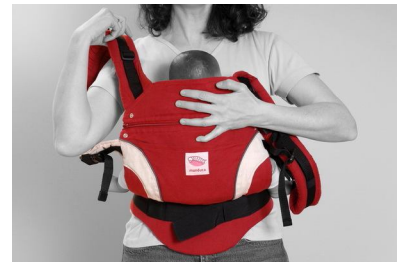
Fig. 6. Ræk ud efter en bærestrop og før den op på din skulder, mens du med den anden hånd holder barnet ind i mod dig.