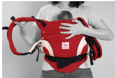
Fig. 5. Bærestropperne er i forvejen sat sammen – husk det skal sige "klik"