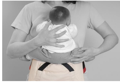
Fig. 2. Tag barnet op mod din mave med dets ben ledte spredte.