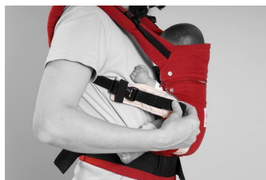
Fig. 11. Træk i de korte ender af bæltet...