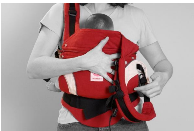
Fig. 7. Byt hænder og før den anden bærestrop op på modsatte skulder.