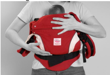
Fig. 4. Lad barnet glide så langt ned i bæreselen som muligt. Der må ikke være plads mellem barnets bagdel og bærestykket.