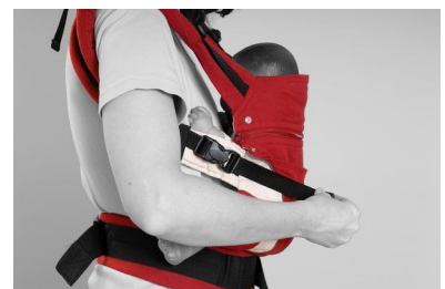
Fig. 12. ...for at stramme bærestropperne.