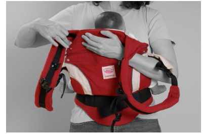
Fig. 3. Før bærestykket op mellem barnets ben og godt op omkring barnets ryg.