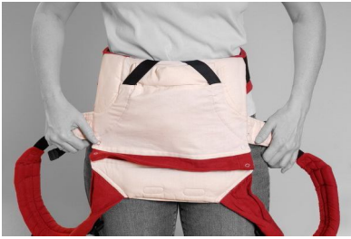
Fig. 1. Luk hoftebæltet og før spændet om på ryggen. Bærestykket hænger ned foran dig som et forklæde.